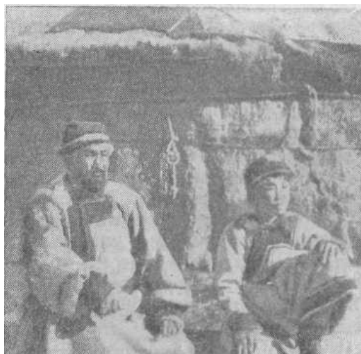
Бай с сыном. Алтай.