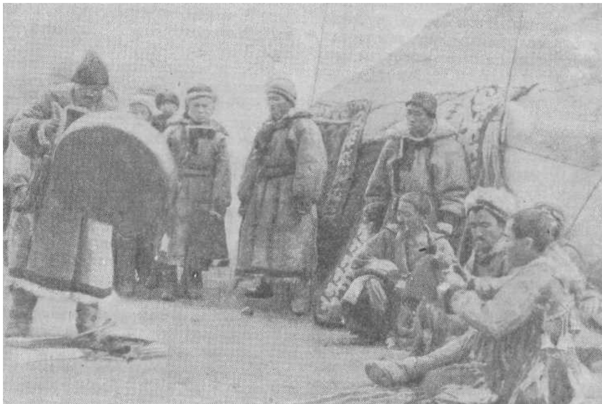
Заклинания шамана. Алтай.