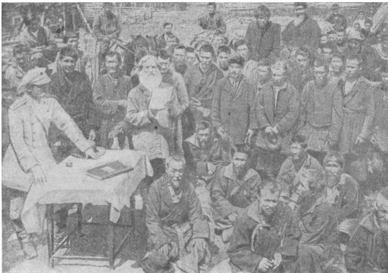
Выборы старшины на Алтае с участием русской полиции.

Одинаково была встречена мобилизация и на правом берегу Катуня, т.е.